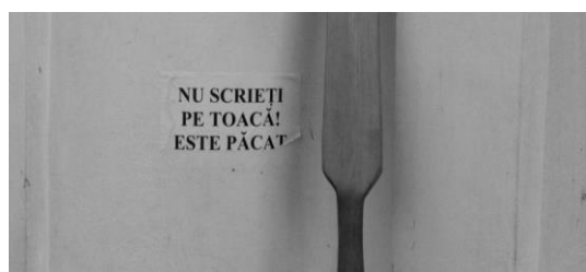
Figura 3.1 Mesaj adresat turiștilor care vizitează Mănăstirea Secu

○ necunoașterea și nesocotirea, cu bună știință, a obiceiurilor și tradițiilor locale de către turiști.