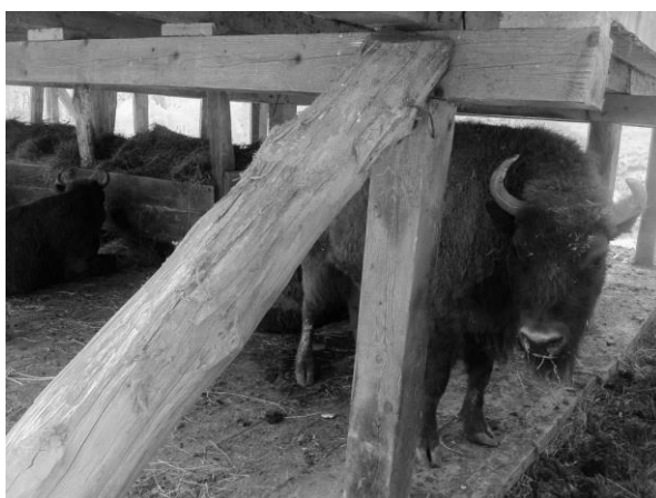
Figura 4.1 Zimbrăria din comuna Vânători, jud. Neamț

Dezvoltarea turismului schimbă radical această situație, deoarece speciile rare ale faunei și florei dobândesc o valoare economică doar dacă sunt în viață . Transformate în atracții turistice, ele sunt apărute în parcuri și rezervații – iar comunitățile locale găsesc în turismul ce se dezvoltă în jurul acestora o sursă alternativă de venit. Astfel, turismul este singurul care poate asigura trecerea de la braconaj la safari sau de la pescuit oceanic la whale watching (contemplarea balenelor).